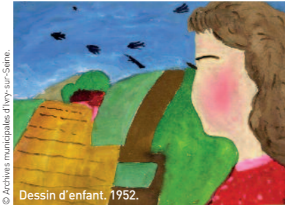
Dessin d'enfant, 1952.