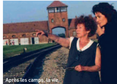
Après les camps, la vie.