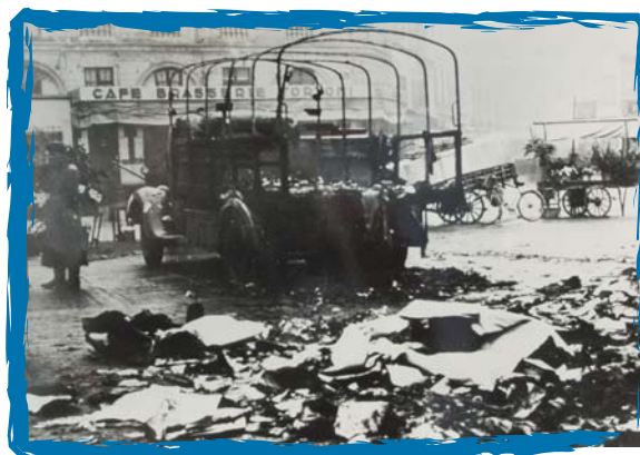
Attentat de la 35e Brigade FTP-MOI contre des convois de transport allemand à Toulouse en février 1943.