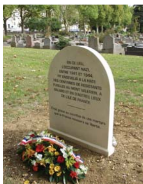
La stèle " Division 40 ".

Un monument à la mémoire des fusillés du Mont-Valérien a été inauguré le 20 septembre 2003. On y relève le nom des résistants de la MOI fusillés le 21 février 1944.