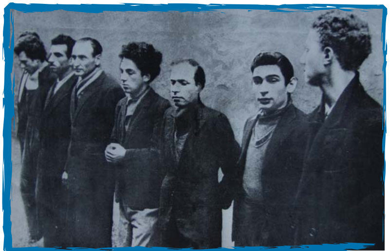
Le groupe Manouchian après son arrestation.