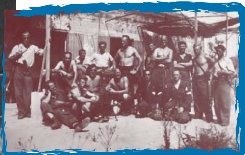
Des antinazis allemands, ayant combattu dans les brigades internationales, dans un maquis de Lozère.