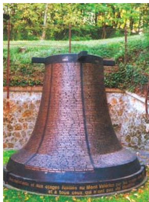
Le monument à la mémoire des fusillés du Mont-Valérien.

Commémoration au cimetière d'Ivry du premier anniversaire de l'exécution du groupe manouchian, 25 février 1945.