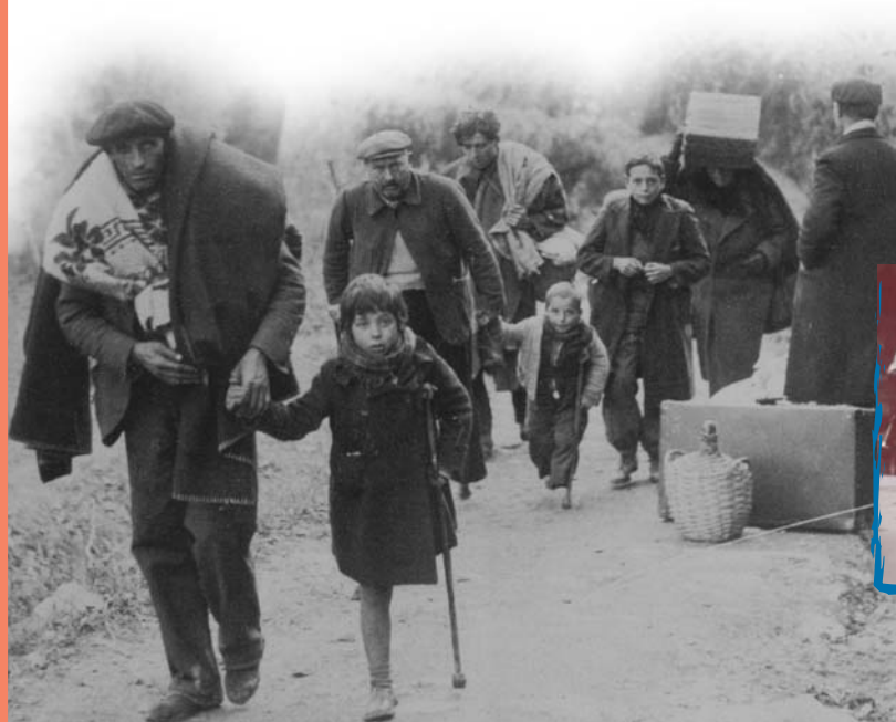
Perpignan 1939. Après la prise de Barcelone par les franquistes, l'exode des Espagnols vers la France s'amplifie (à gauche).