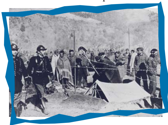
Camp d'Amélie-les-Bains où, à partir de 1939, sont placés sous haute surveillance des combattants républicains espagnols et des brigadistes étrangers.

Lorsqu'en septembre 1939, la France déclare la guerre à l'Allemagne nazie, un grand nombre d'étrangers veulent s'engager au service de l'armée française. D'autres, victimes d'une politique de répression, sont internés dans des camps. Nombreux sont ceux qui rejoignent les rangs de la France libre ou les maquis de la Résistance où ils vont tenir une place très importante.