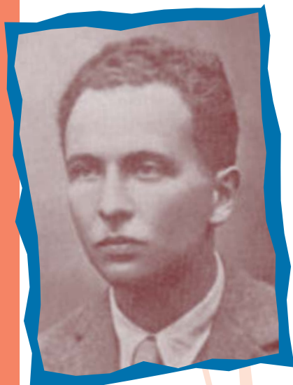
Louis Aragon écrivain, poète français 1897-1982